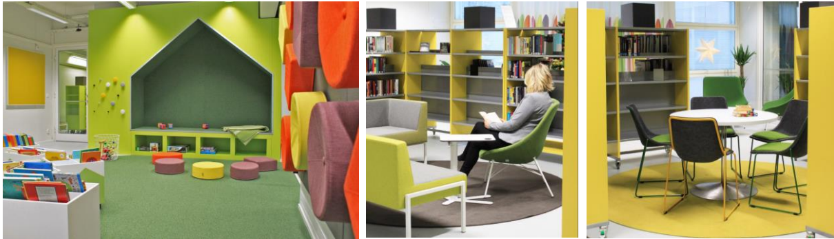
Länsimäen kirjasto