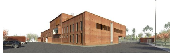
Keravan ja Tuusulan paloasema ja VPK – havainnekuvia