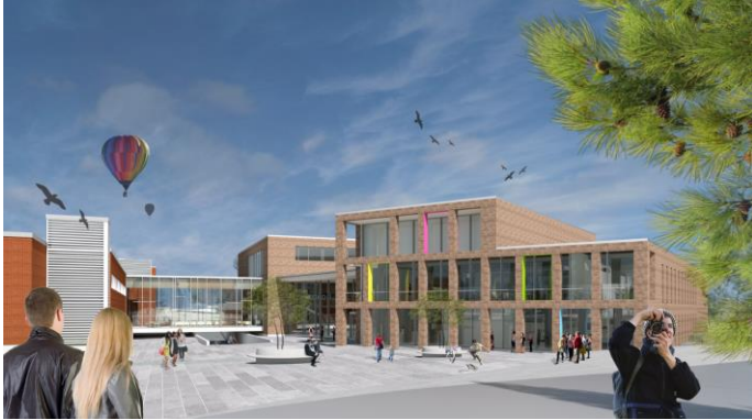
Laurentiustalo – havainnekuva pääsisäänkäynniltä