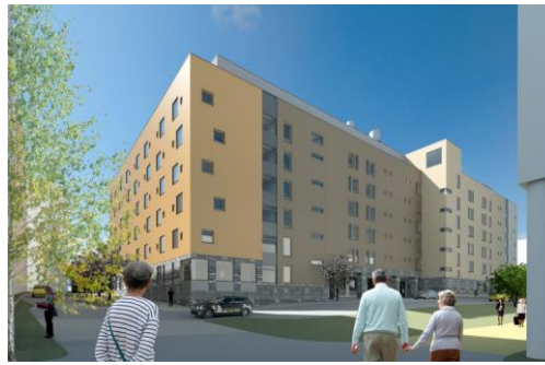
VAV Myyrmäen asumiskeskus - havainnekuvia