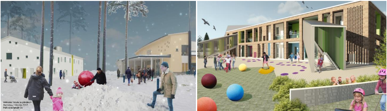
Veikkolan koulu ja päiväkoti – havainnekuva pihalta sekä Laurentiustalon päiväkoti – havainnekuva leikkipihalta