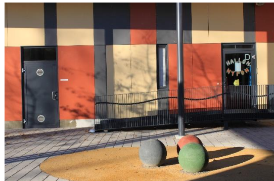
Dickursby skola och daghem leikkipiha