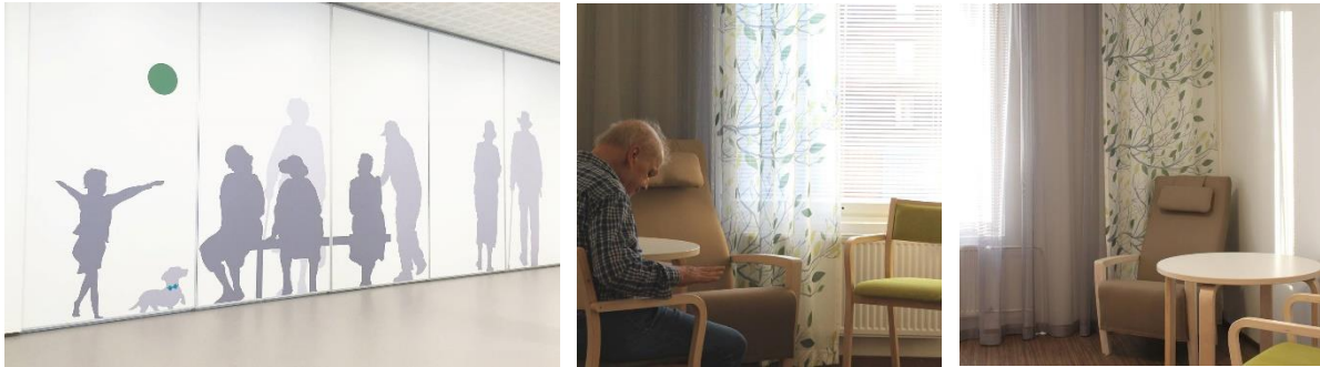
Korson vanhustenkeskus aulanäkymä ja Jaspiskuja kuvia asukashuoneista