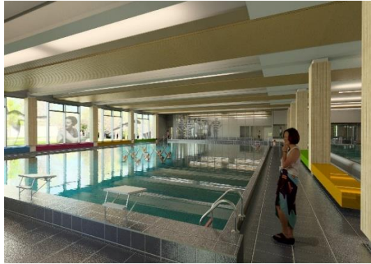
Keravan uimahalli - ulko- ja sisänäkymät