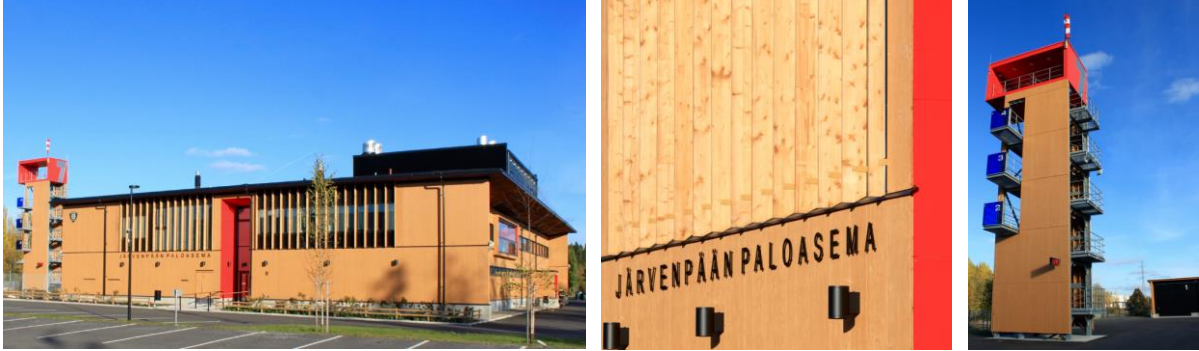
Järvenpää paloasema