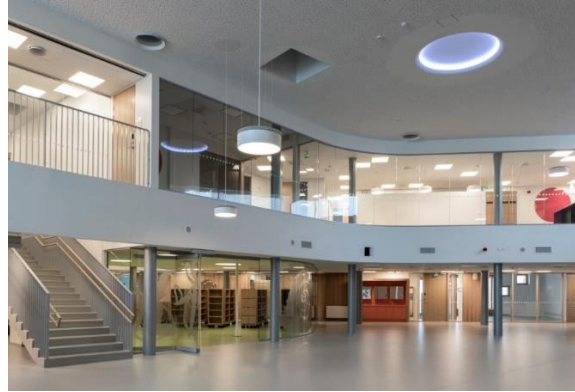
Ojaniittutalo, leikkipiha, pääaula